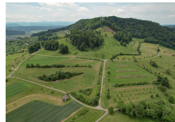
So strukturreich sieht es mittlerweile am Farnsberg aus!