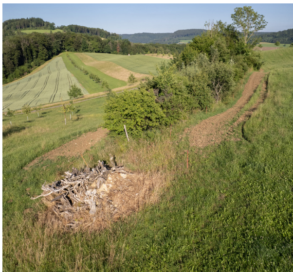
Ein kombinierter Ast- und Steinhäufen, eine Hecke, offener Boden und neu gepflanzte Hochstamm-bäume – so entstehen wieder Lebensräume.

Wir bauen Ast- und Steinhäufen, legen Blumenwiesen, Buntbrachen, offene Böden und extensive Weiden an, pflanzen Hochstamm-bäume, Gebüschgruppen und Hecken und hängen Nistkästen auf, um die Landwirtschaftsflächen aufzuwerten. Dadurch finden viele der mittlerweile selten gewordenen Arten hier wieder einen Raum zum Leben.