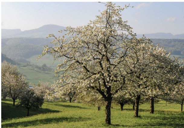
Die Zeit der Kirschblüte ist die schönste Zeit im Obstgarten Farnsberg.

Durch dieses Projekt zeigen wir auf, dass landwirtschaftliche Produktion und Naturschutz Hand in Hand gehen können!