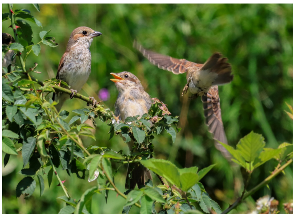
Neuntöter-Familie am Farnsberg.

Am Mittag kann an den vorbereiteten Feuerstellen grilliert werden. Lokale Getränke (Schorle, Most und Chriesaft) und ein feines Dessert werden vom Projekt offeriert. An verschiedenen Ständen informieren die Projektpartner über die Geschichte und die Gegenwart des Projekts Obstgarten Farnsberg. Auch für Kinder und Jugendliche gibt es verschiedene Aktivitäten.